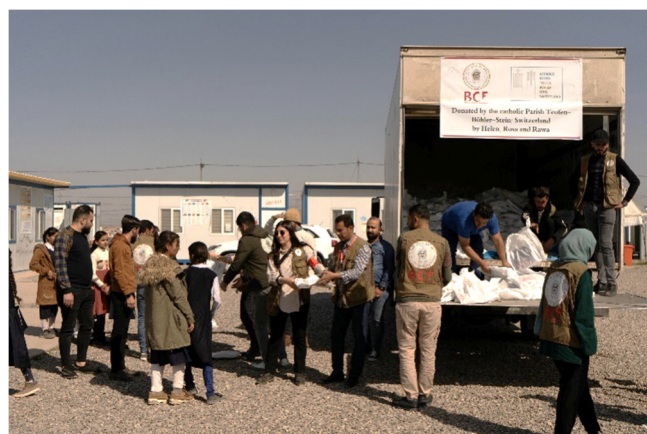
Verteilung von Lehrmittel und Schulmaterial in den Camps