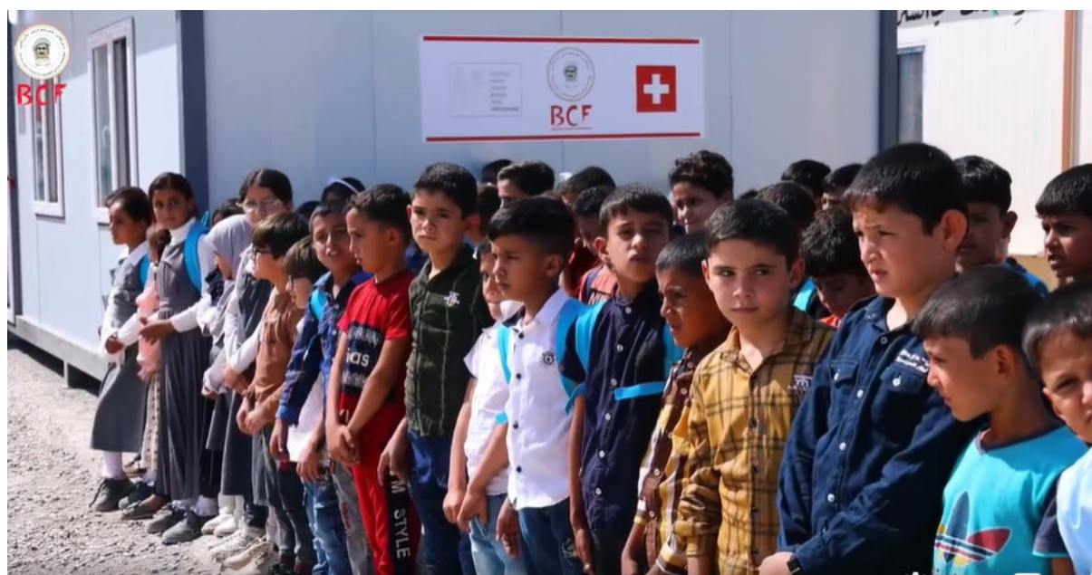
Übergabefeier der Schulcontainer und Schulbänke